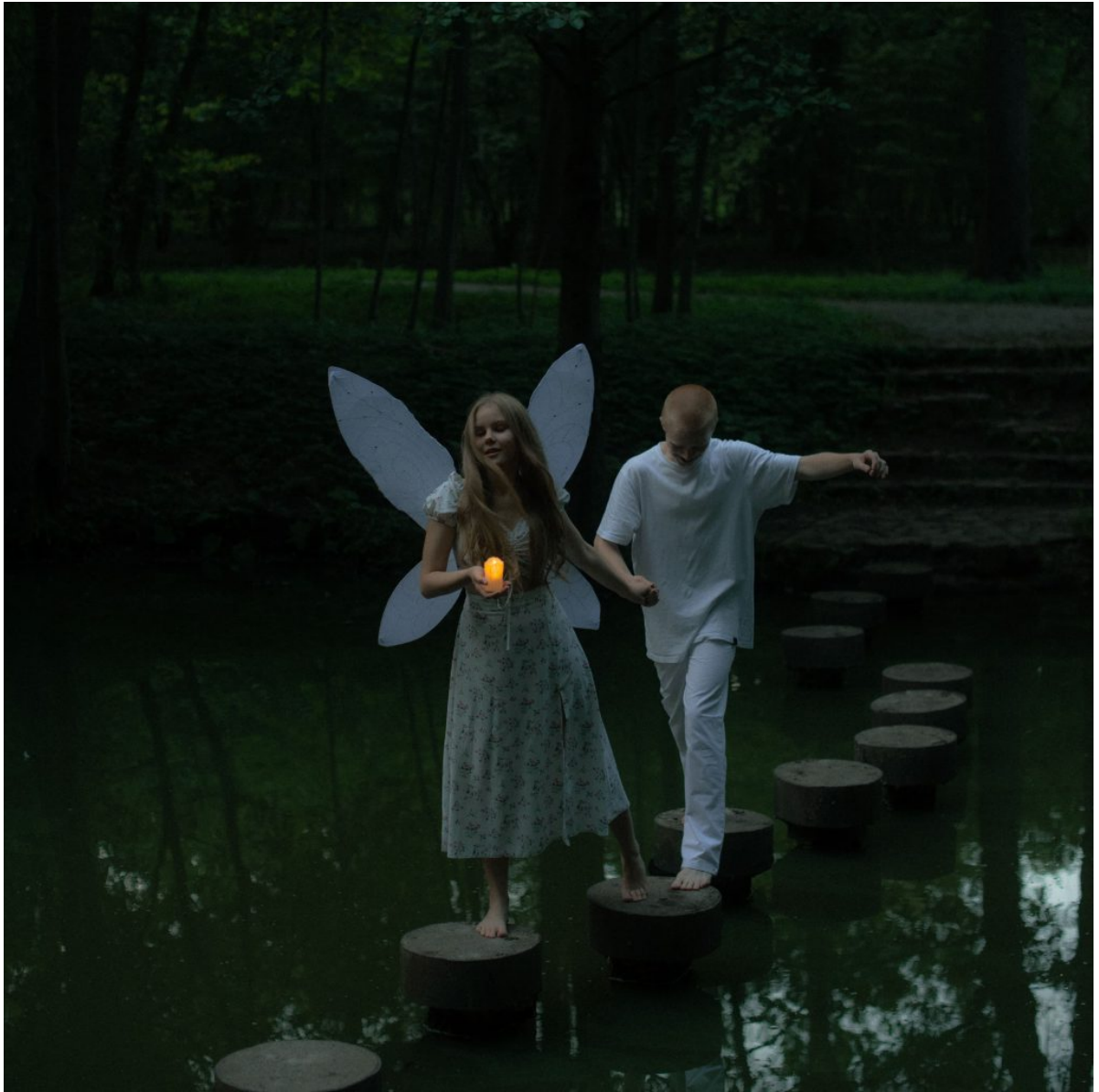
Серия фотографий “Английская мифология” – ДМЛ-1

Когда вода Всемирного потопа Вернулась вновь в границы берегов, Из пены уходящего потока На сушу тихо выбралась Любовь Свежий ветер избранных пьянил, С ног сбивал, из мёртвых воскрешал Но страсть пришлось им прекращать Ведь появилась Артуровская власть Влюбленность брат не мог ей простить, Он сердце Морганы хотел укротить, И вместо в темнице оставить ее