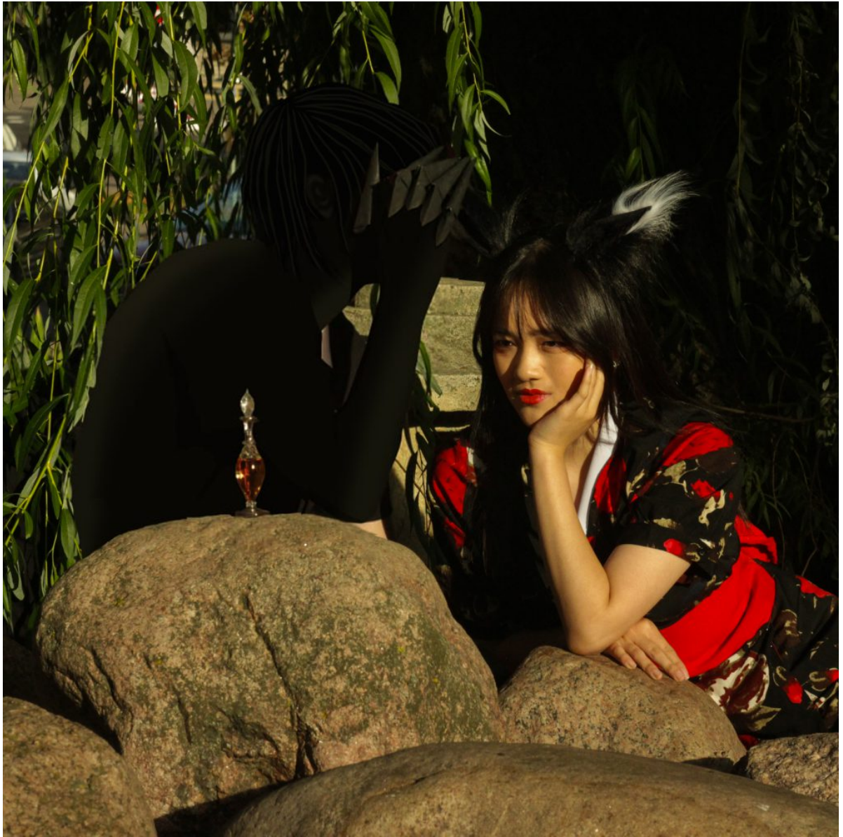
Серия фотографий “Японская мифология” – ДМВ

Покачивая кроны деревьев ранним утром, северный, не типичный для страны восходящего солнца, ветер тихонько завывал, нарушая тишину, опустившуюся на долину. Где-то вдали, между деревьями, слышно, как кто-то потрескивает ветками, пугая птиц. Не нашлось бы человека, не знающего старого бродягу-музыканта. Он кочевал по стране и, играя на сямисэне, рассказывал местным детишкам легенды. Его любимой была о многохвостой лисице-оборотне, которая обладает волшебной силой, забирает души людей и живет более тысячи лет. Люди верили ему, верили в кичунэ, которая своей магией, словно красными нитями, проходит меж жителей, разрушая их блаженный покой. Даже сейчас, в