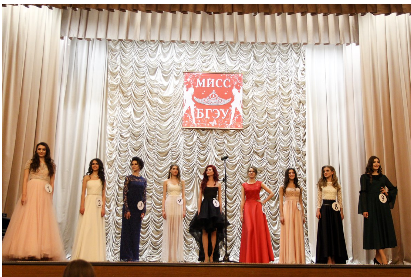
Участницы “Мисс БГЭУ” на сцене