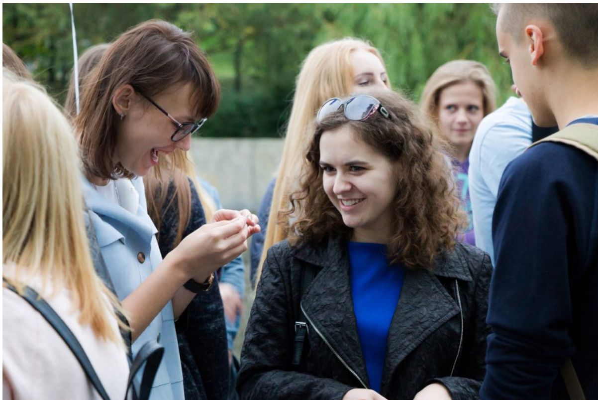
Fmk freshmen welcoming

Ура! Наконец-то пришла наш культорг Наташа. Общение с ней началось сразу- с помощью любимой кричалки ФМк. Слышно наших ребят было везде, ведь кричали все до одного – успевай только подхватывать!