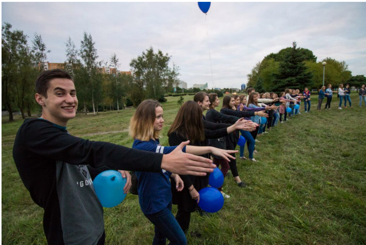
Fmk freshmen welcoming

Кто будет помогать первокурсникам на их пути знакомства со студенческой жизнью? Конечно тьюторы- студенты старших курсов, всегда готовые прийти на помощь студентам первого курса! Поэтому в первую очередь познакомились с ними.