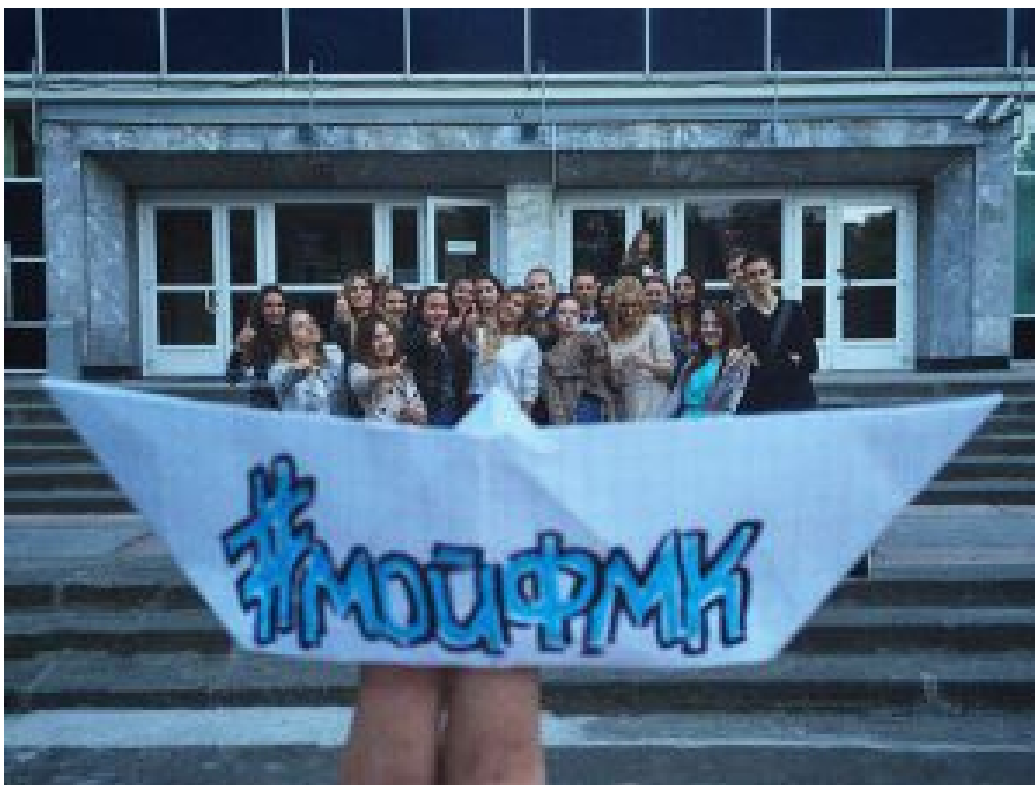
дружные первокурсники ДМЛ-1

Стены университета, кораблик и дружные первокурсники из группы ДМЛ-1. Что ещё нужно для счастья? Разве что только моря не хватает. «ФМК не даст заплывать за буйки».