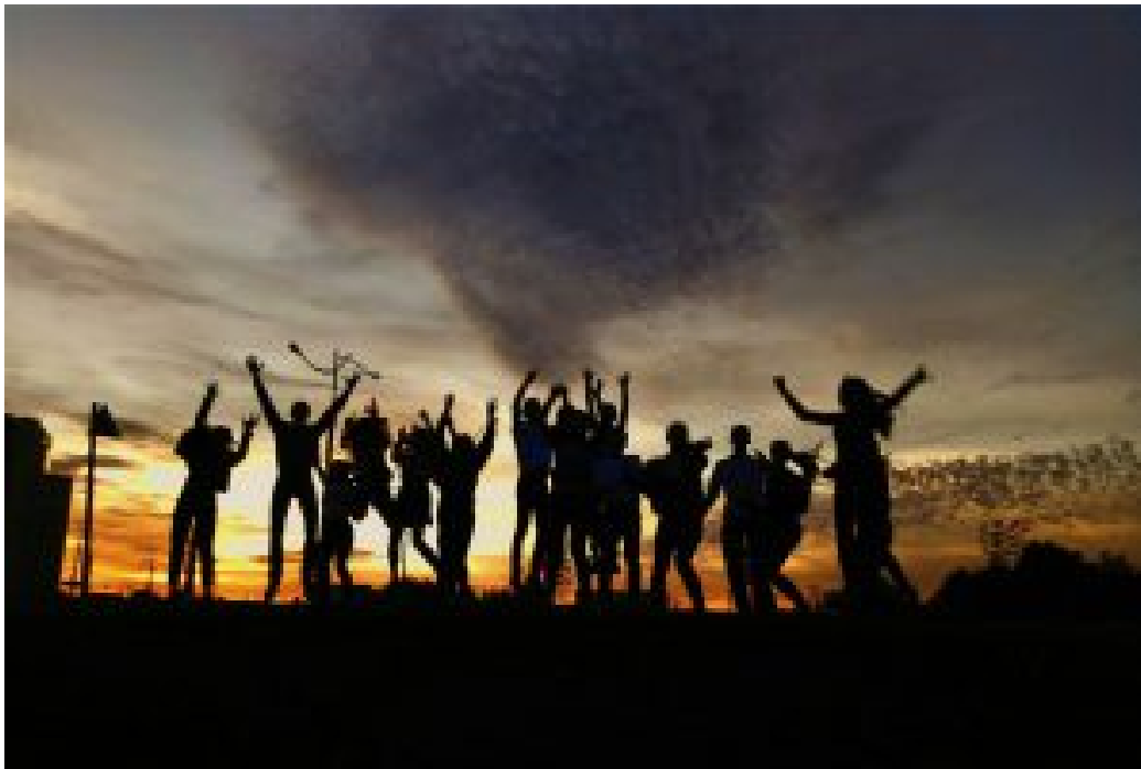
маленькая семья первокурсников ДМП

Стены университета, кораблик и дружные первокурсники из группы ДМЛ-1. Что ещё нужно для счастья? Разве что только моря не хватает. «ФМК не даст заплывать за буйки».