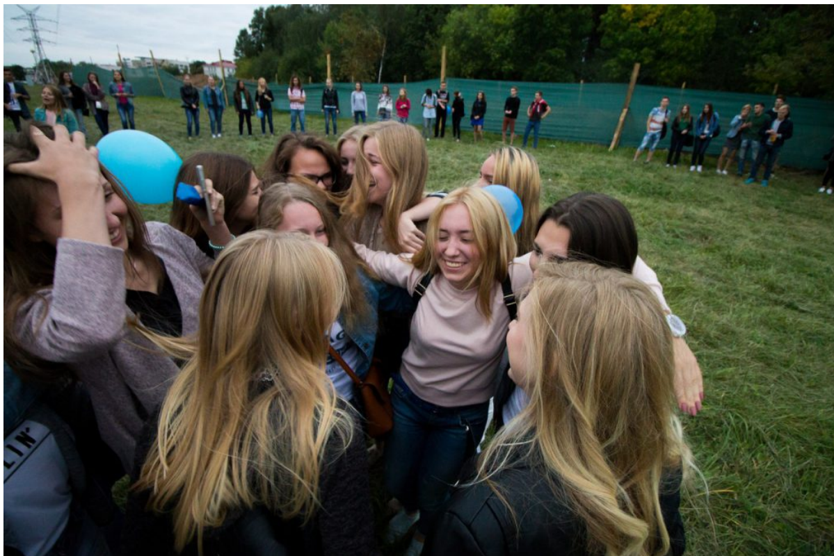
Fmk freshmen welcoming

Закончив обниматься, ребята разбились на группы в соответствии со специализацией и продолжили общение с тьюторами. Старшие рассказывали младшим про жизнь в универе, преподавателей, мероприятия и просто знакомились. То тут, то там раздавались смех, счастливые голоса студентов. Может попасть в семью ФМк и есть счастье?