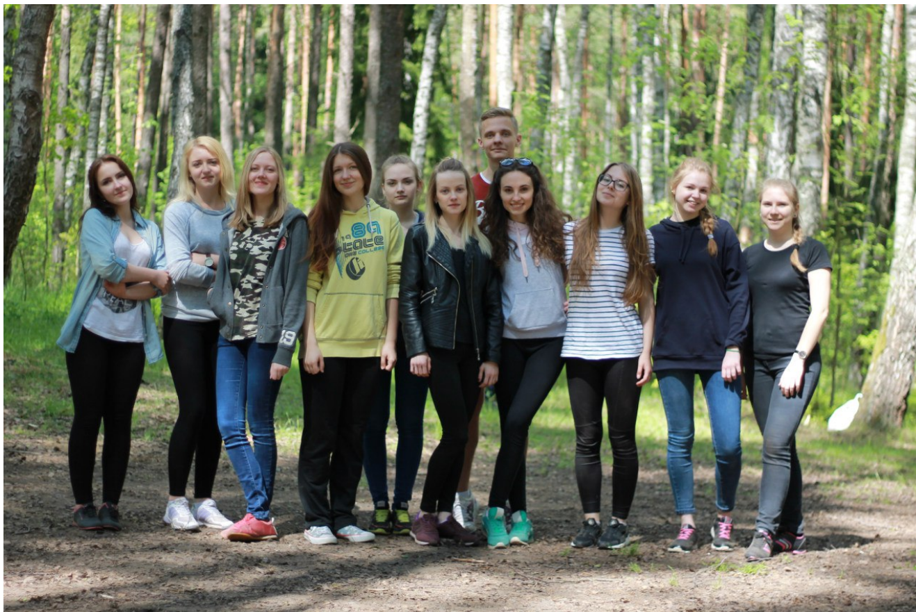
Команда “Крым” – Вербки ФМк 2016

У каждой семьи рано или поздно появляются свои традиции, и Вербки ФМк – как раз одна из них! Так что пожелаем участникам весеннего сезона удачи, положительных эмоций и ярких впечатлений. А всех остальных ждем осенью! Присоединяйтесь к традициям семьи ФМк!