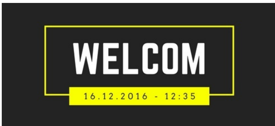
Акция: Тайны Рождества с ФМк

Вот бывает, что хочется праздника. Просто так взять и порадоваться, посмеяться, съесть вкусную конфету, расцеловать подругу или друга, просто взять и танцевать беззаботно и свободно. Иногда хочется отвлечься от лекций, итоговых контрольных, страшных слов “рейтинг”, “пересдача” и “недопуск”; хочется посмотреть в окошко, пойти в кофейню или загрузить фотку в Instagram.