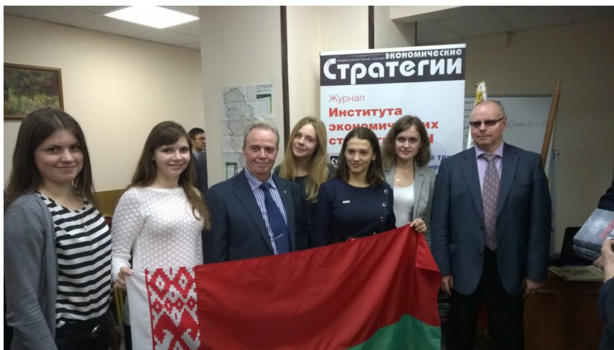
Участники международного конкурса «Валюта ЕАЭС – 2015»