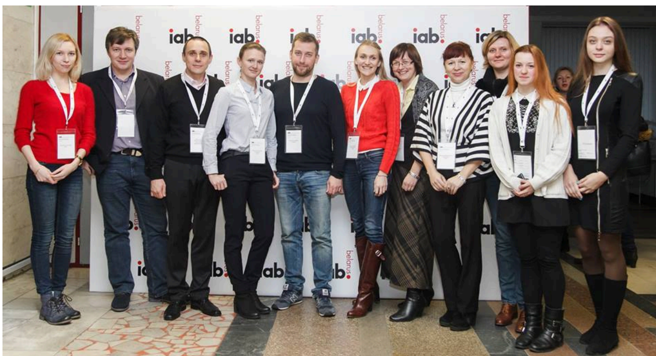
Преподаватели и студенты ФМк также посетили конференцию