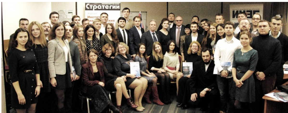
Участники международного конкурса «Валюта ЕАЭС – 2015»