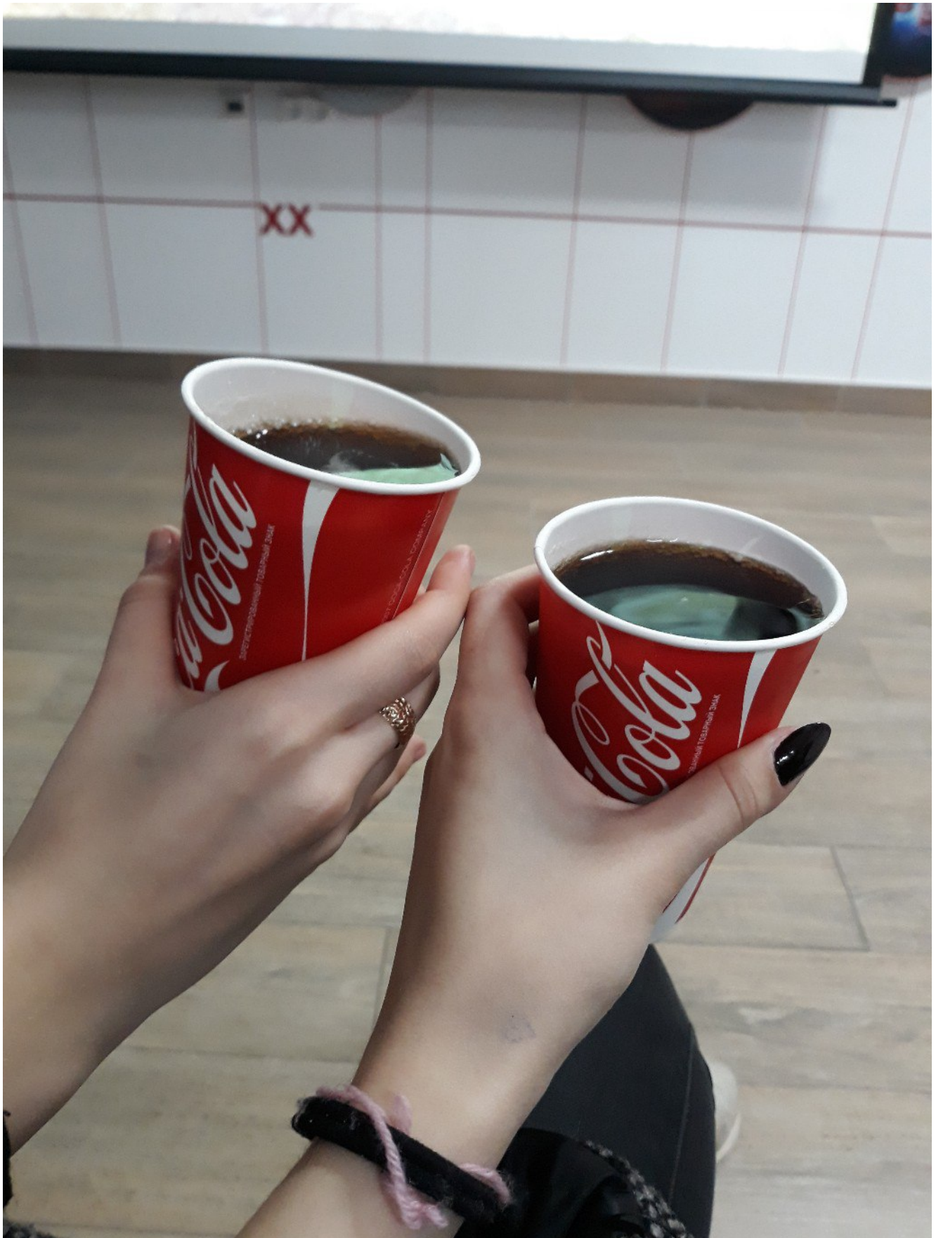
Дегустация напитка на заводе “Кока-Кола”.

Поначалу практика кажется чем-то скучным, однообразным и сложным. Согласитесь, перспектива ходить на незнакомые