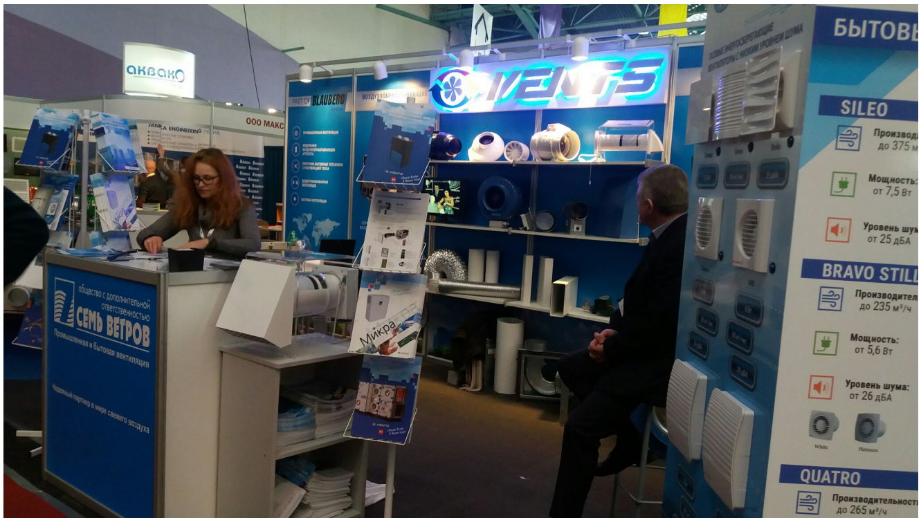
Выставка “Вода и тепло”.

Не менее важен и раздаточный материал, ведь, просмотрев огромное количество экспонатов выставки, тяжело выделить и запомнить всю необходимую продукцию. И только дома, в спокойной атмосфере, можно пролистать предоставленный буклет или журнал, освежить в памяти выставочную продукцию, и выбрать именно то, что больше всего Вам подходит. Красиво представленные, стильные, лаконичные, современные журналы и буклеты смотрится выигрышно по сравнению с другими, к таким хочется возвращаться вновь и вновь, изучая представленную продукцию.