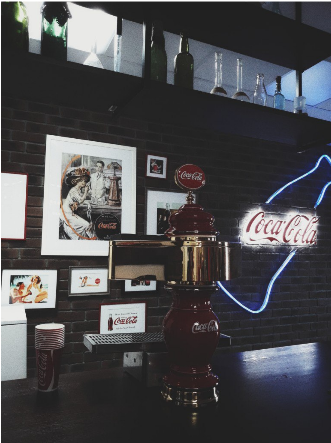
Оформление завода.

В небольшой комнатке, специально оборудованной для экскурсий, приятная девушка рассказала нам об истории создания,