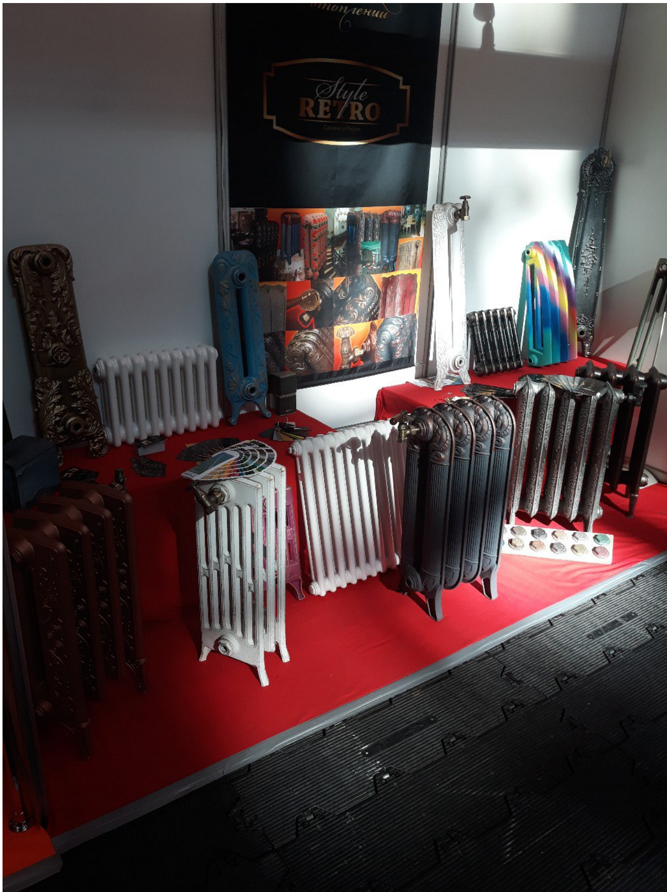
Выставка "Вода и тепло".

Выставка оказалась очень полезной и информативной для нашей специальности, и теперь мы вряд ли упустим возможность