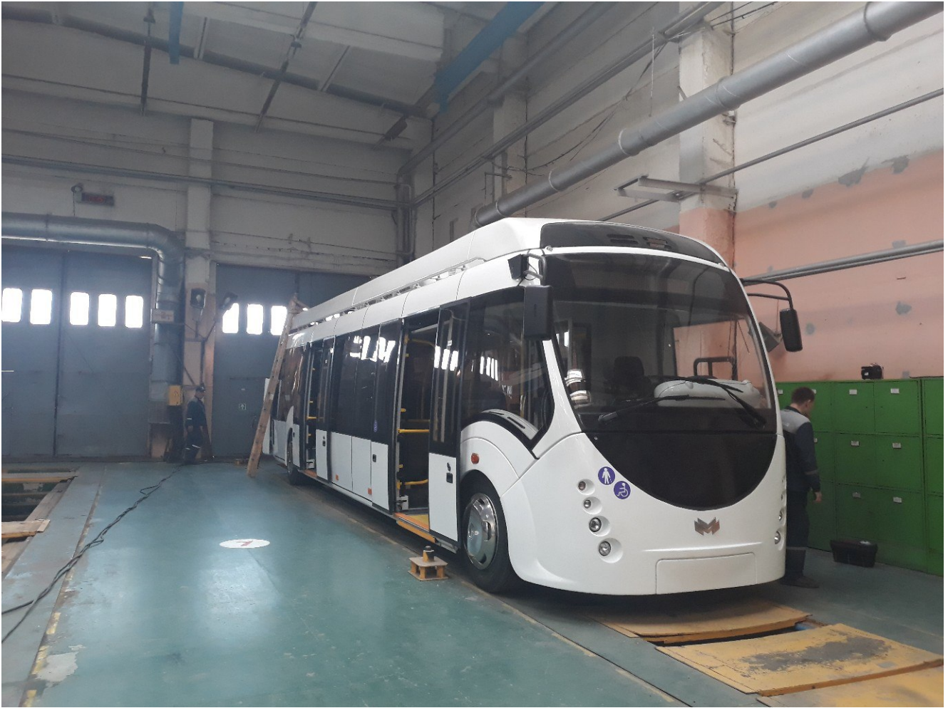
Процесс изготовления электробуса.

На производстве мы увидели слаженную работу всего коллектива. Было заметно, что каждый на своем месте четко выполняет свои обязанности. Приятно, что продукция нашего белорусского предприятия востребована за рубежом в таких странах как Казахстан, Румыния, Молдова, Сербия и других европейских государствах, а также в странах Латинской Америки. Учитывая, какая сейчас идет борьба за потребителя и высокую конкуренцию – это большое достижение Белкоммунмаша. Очень важен современный дизайн, ведь техника должна быть не только качественной и надежной, но и эстетически привлекательной, современной. Всё это действительно поразило каждого из нас.