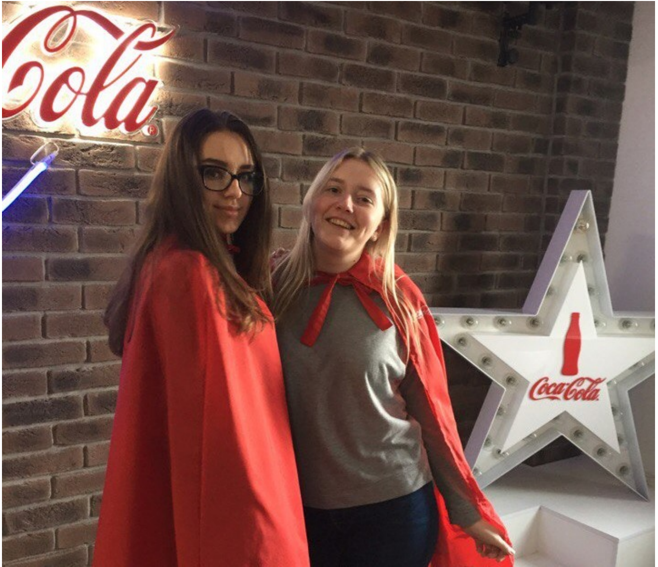
Группа ДМР на заводе “Кока-Кола”.