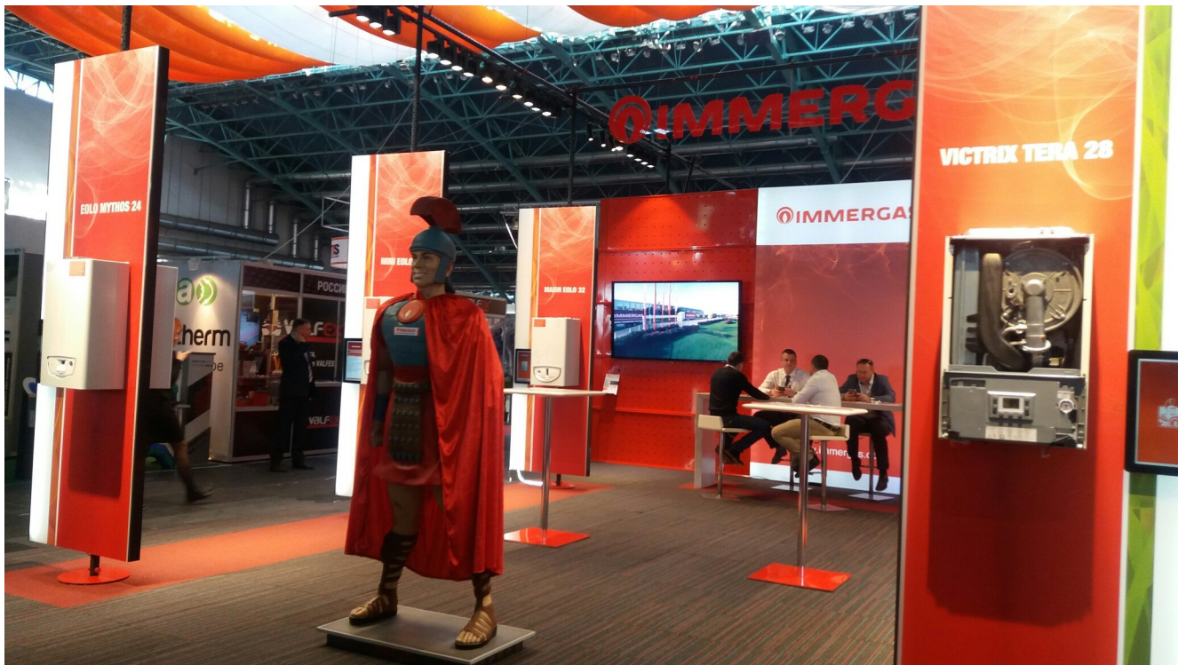
Выставка “Вода и тепло”.

На выставке в небольших огороженных комнатах свою продукцию представляли как белорусские, так и иностранные фирмы разного уровня. Нас ожидало не менее интересное задание – изучить данные фирмы по трем критериям: качество работы персонала, выставочная продукция и информативность раздаточного материала.