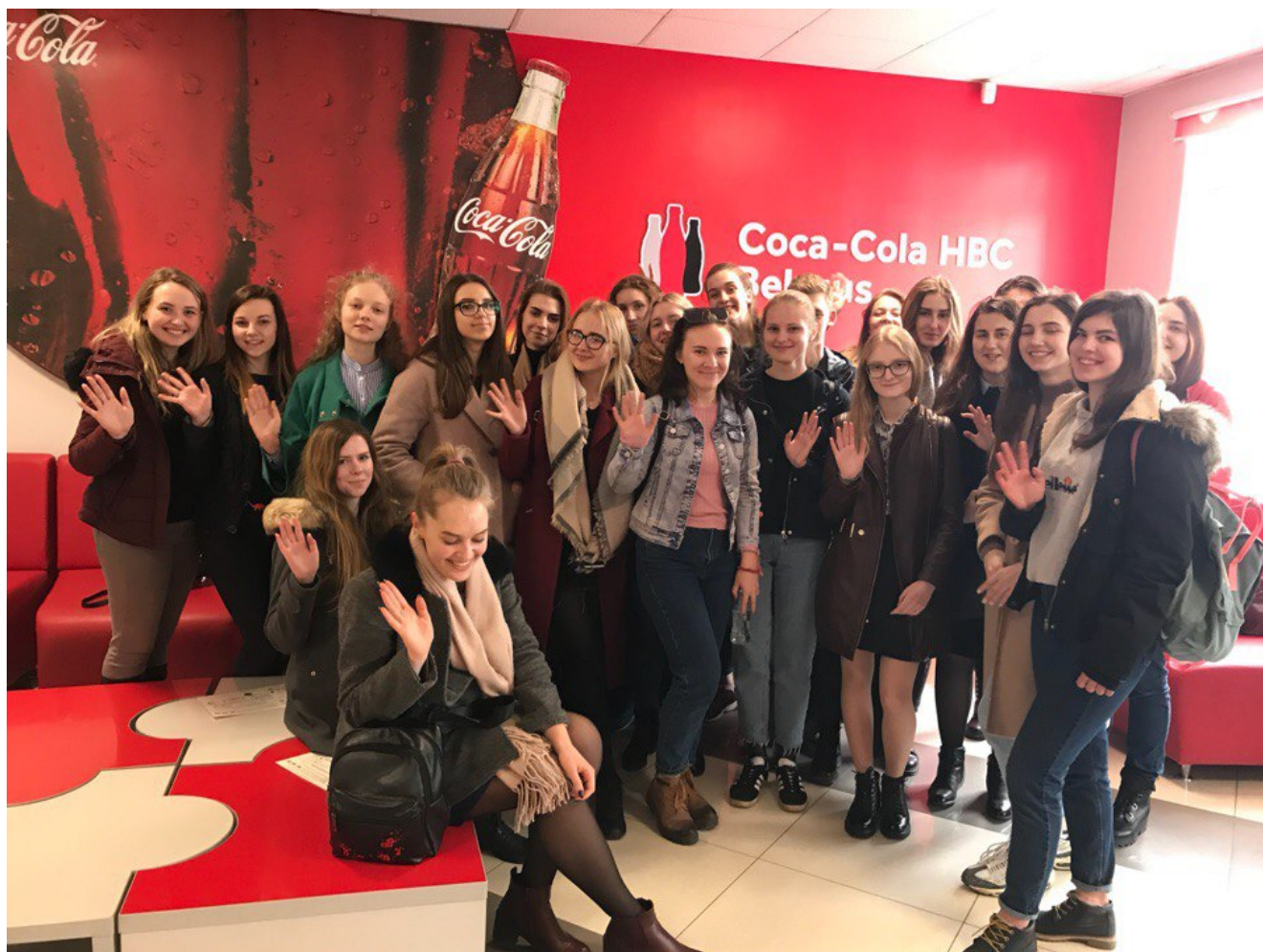
ДМР на заводе “Кока-Кола”

Весна... Состояние души, постоянно отвлекающее от однообразных лекций и бесконечного потока пар. Прекрасная погода на улице и яркое солнце так и манят изменить что-то в своей жизни, открыть себя навстречу новому, незнакомому ранее. Впустив однажды в сердце весну, ты уже не можешь усидеть на месте хотя бы несколько минут, а конец учебного года всячески пытается напомнить, что вот-вот в гости постучится сессия. Именно сейчас, как никогда ранее, важен глоток воздуха, свежих, ярких впечатлений, это и предоставляет нам практика.