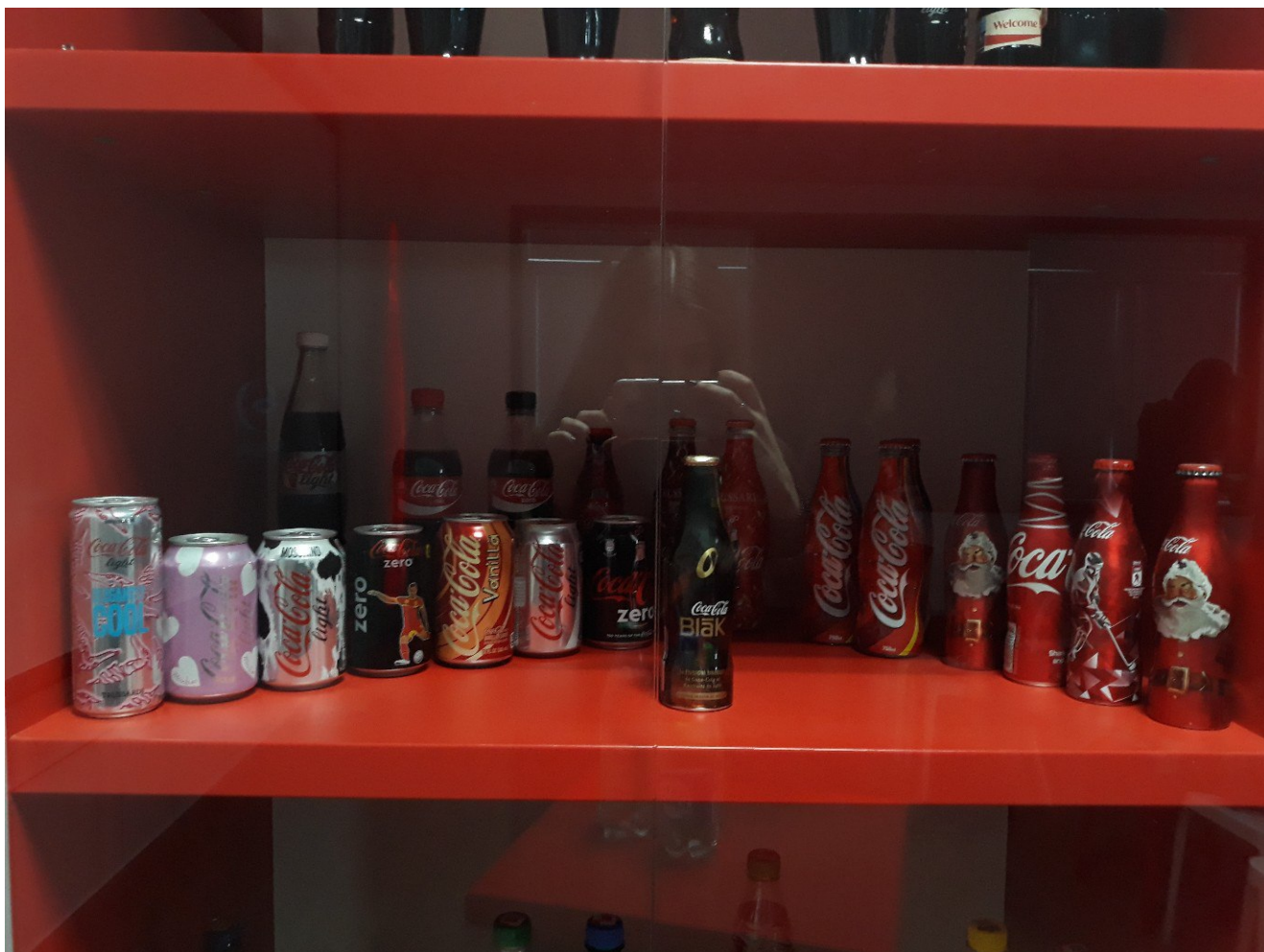
Разнообразие напитков завода.

Под милую, белорусскую рекламу с участием NaviBand первокурсников угостили любимыми напитками предприятия. Приятный вечер завершился викториной, главный приз которой – большой мишка. Каждый из нас на память получил брелочки кола-колы и кучу приятных впечатлений. Еще долго не хотелось покидать предприятие, ведь нужно заполнить социальные сети запоминающимися фотографиями. Да... Кока-Кола действительно то, что нас объединяет!