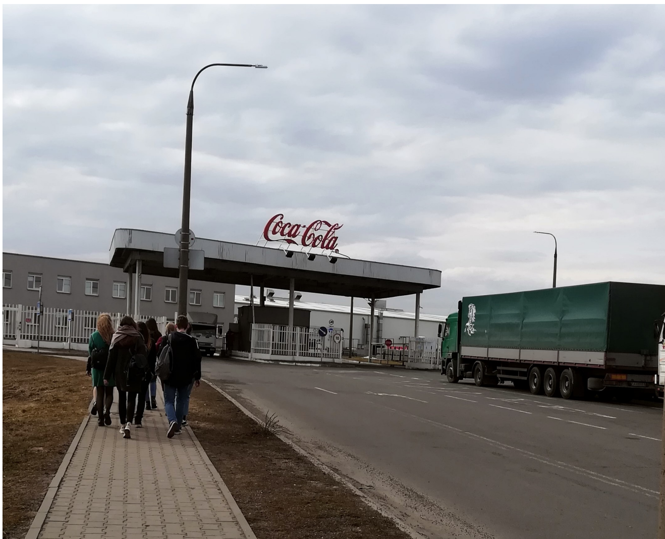
Завод «Кока-Кола».

Кока-кола – знакомый с детства, всеми любимый напиток. Что приходит Вам в голову при упоминании данного названия? Новый год, семья, счастье... и много других, неповторимых, но таких приятных ассоциаций. Я думаю, каждый из нас хотя бы раз мечтал отправиться на завод Кока-Кола и своими глазами увидеть колдовство приготовления любимого напитка. Экскурсия нашей практики как раз и адресовалась туда. Первое, что мы заметили, как только добрались до предприятия, – красно-белые фургончики с известным логотипом, с помощью которых напиток путешествует из города в город и объединяет людей. Да-да, именно такие, как в новогодней рекламе.