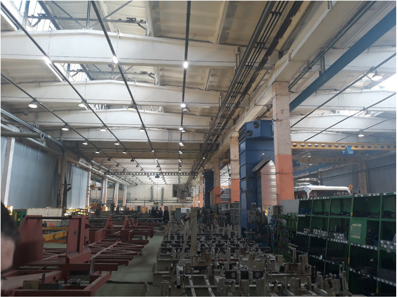
Цех предприятия “Белкоммунмаш”.