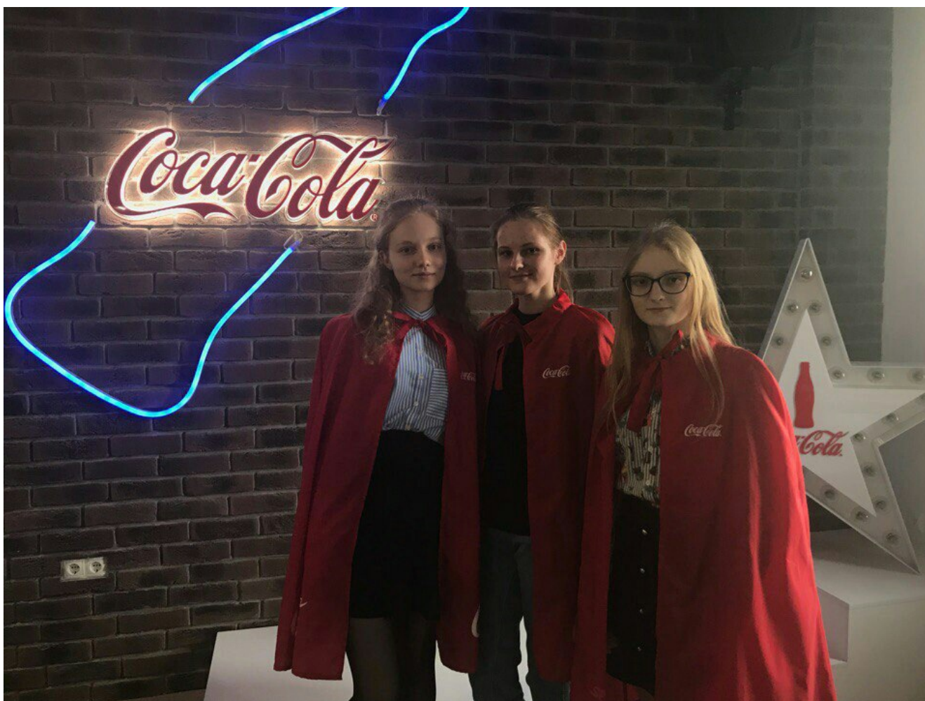
На заводе Кока-Кола.

предприятия по вечерам, изучать специфику их структуры, экономические показатели за последние несколько лет, положение на внутреннем и внешнем рынке, стать постоянным гостем отдела маркетинга и продаж, а также бухгалтерии данных предприятий, а затем записывать это все в отчет – не очень радует. Но не тут-то было! Уже второй год подряд ФМк испытывает новый, увлекательный вид практики. Две экскурсии на знакомые всем предприятия, а также посещение интересной выставки – вот что ждет всех первокурсников в конце учебного года. И лето свободно, и весна запоминающаяся – идеальное решение руководителей практики. А теперь предлагаем вам вместе с нами вспомнить, как это было, и прочувствовать наши эмоции.