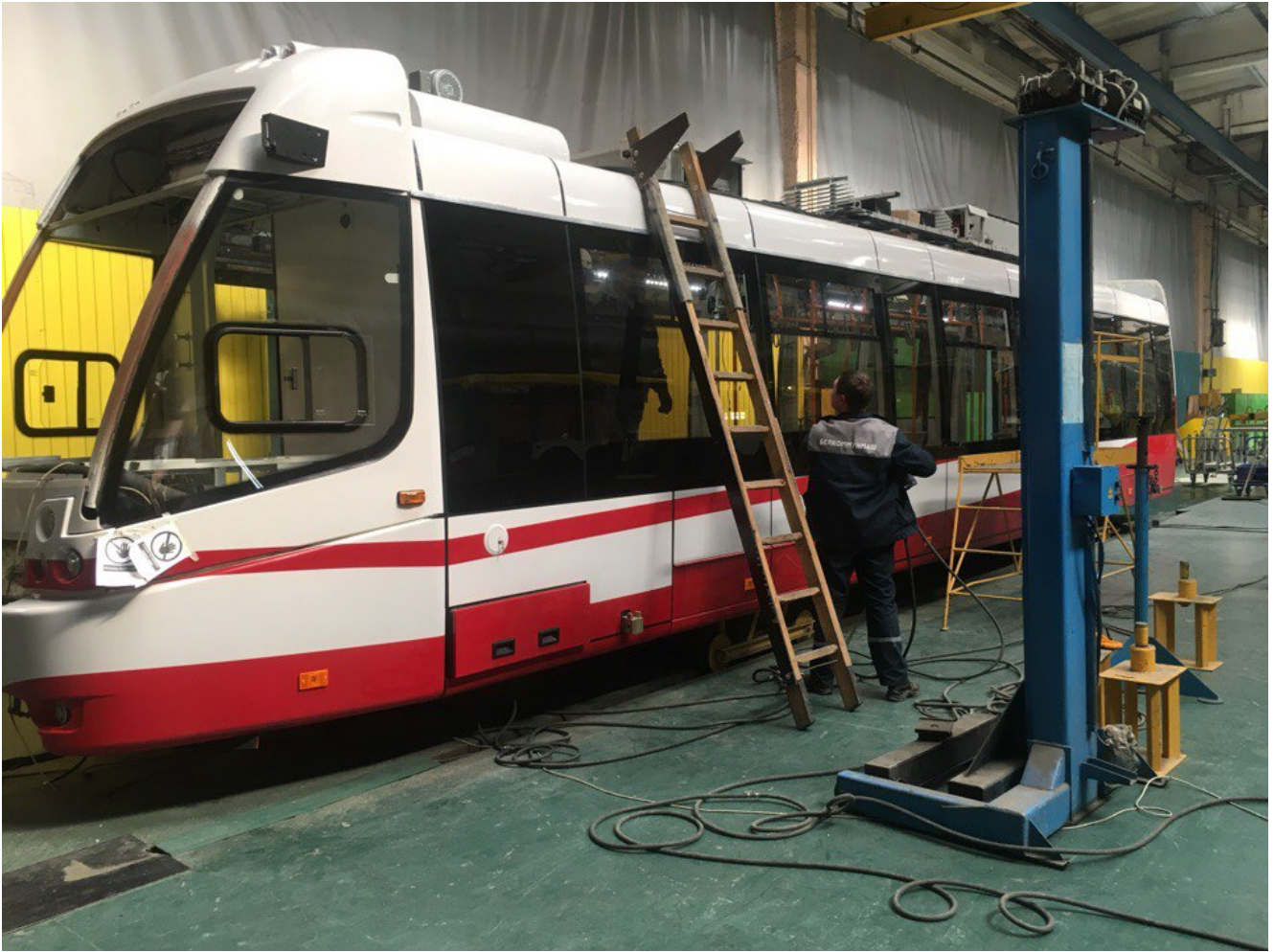
Процесс производства электробуса.

Каждый труженик предприятия на своем рабочем месте должен чувствовать ответственность за производимую продукцию, выполнять свою работу на совесть, и тогда, на выходе будет востребованный продукт, который найдет своего потребителя. Впечатлили и огромные цеха, при этом всем чувствовалась слаженность действий и порядок.