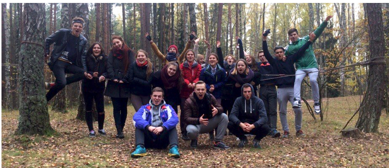
Веревоочный курс ФМк. Осень 2016

Работа-учеба-дом; работа-учеба-дом – скучно, да?! Если жизнь состоит только из этого, то это не жизнь, а какой-то замкнутый круг, даже хуже, чем у хомячка в клетке. Но если среди лекций, уборок, обедов и прочих важностей есть отдых, то старушка Земля под ногами крутится не зря. Так, 16.10.2016 ФМк немного разогнал тучи, раскрасил поярче осенний день и выехал в лес на традиционный Веревоочный курс. Целый день студенты веселились, смеялись, залазили на веревки, пытались не упасть и просто наслаждались этим днем, даже не думая, что завтра будет еще один понедельник-день тяжелый.