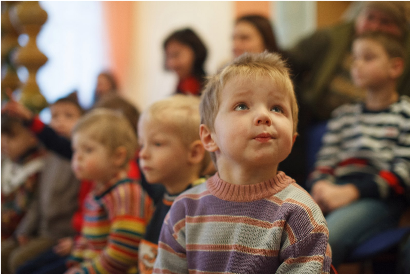
Ждановичский детский дом. Маленькие зрители

Годы шли, люди научились записывать подслушанные в темноте сказки на бумагу. Сами того не зная, они заставили волшебство поселиться на страницах собственных книг. Теперь истории не приходили скрипя половицами к детям, теперь родители сами выпускали их наружу, перелистывая очередную страницу. Но как бы просто не было оживлять сказки, все еще остаются те, кто не может расслышать их шепота и задорных смешков.