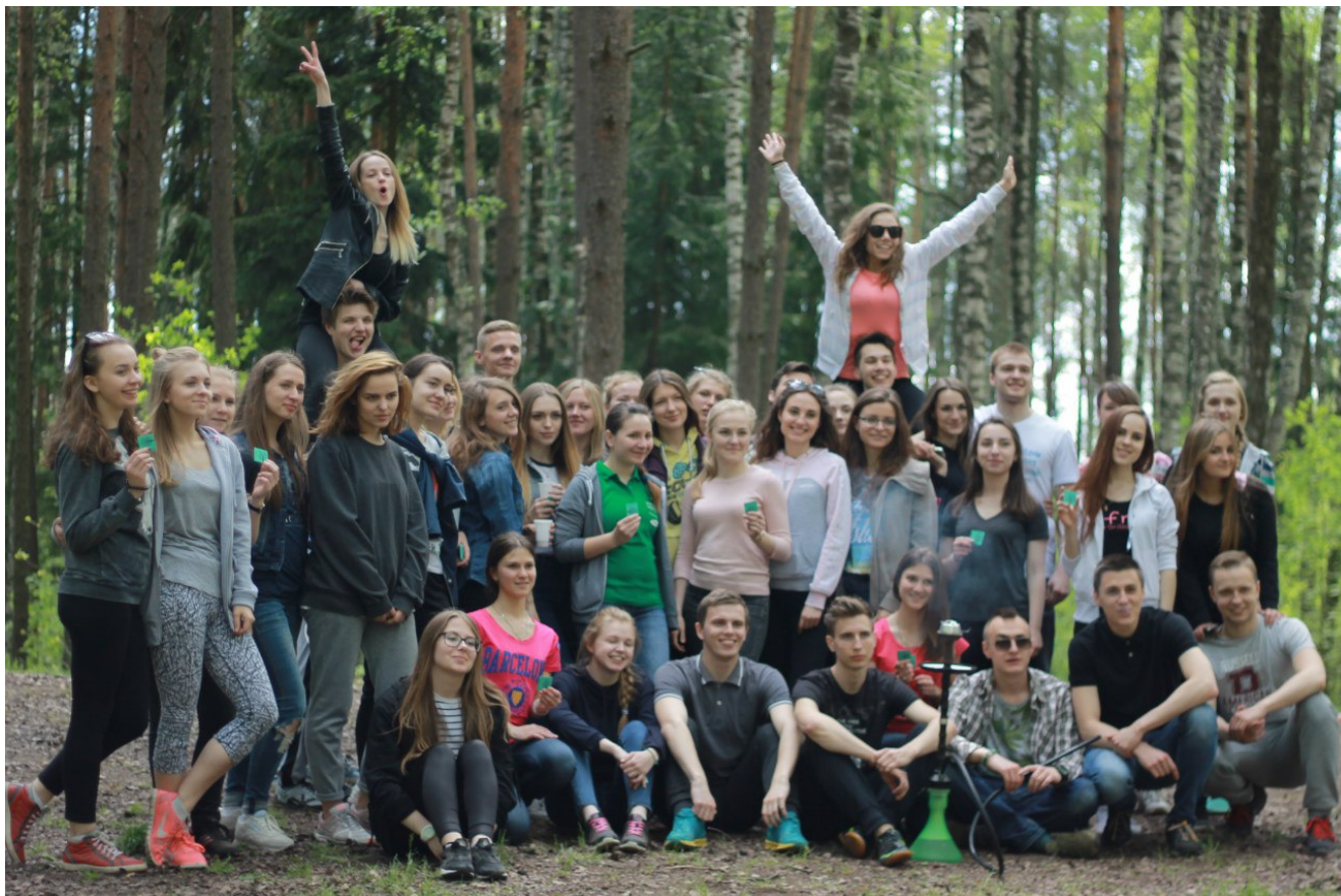
Веревки ФМк: все участники весеннего сезона 2016

В это воскресенье не всем было суждено выспаться и открыть глаза только к обеду. Некоторые, особенно удачливые студенты ФМк, уже в 12:00 были в лесу, мысленно подсчитывая количество комаров на квадратный метр поляны. После небольшой разминки всем участникам нужно было поделиться на команды, придумать название и визитку. Наверное, свежий воздух сыграл свою роль, и названия команд вышли следующие: «Крым», «Правый сектор» и «Корона-Техно». Ну, мы же креативный факультет!?