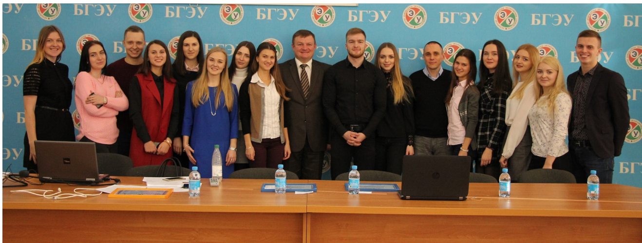
Участники отчетно-выборной конференции Профбюро ФМк