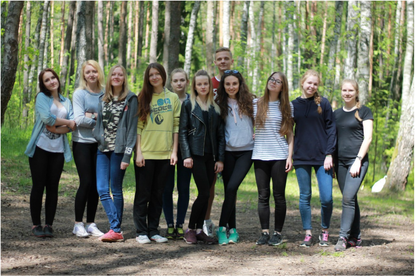
Команда “Крым” – Вербки ФМк 2016

У каждой семьи рано или поздно появляются свои традиции, и Вербки ФМк – как раз одна из них! Так что пожелаем участникам весеннего сезона удачи, положительных эмоций и ярких впечатлений. А всех остальных ждем осенью! Присоединяйтесь к традициям семьи ФМк!