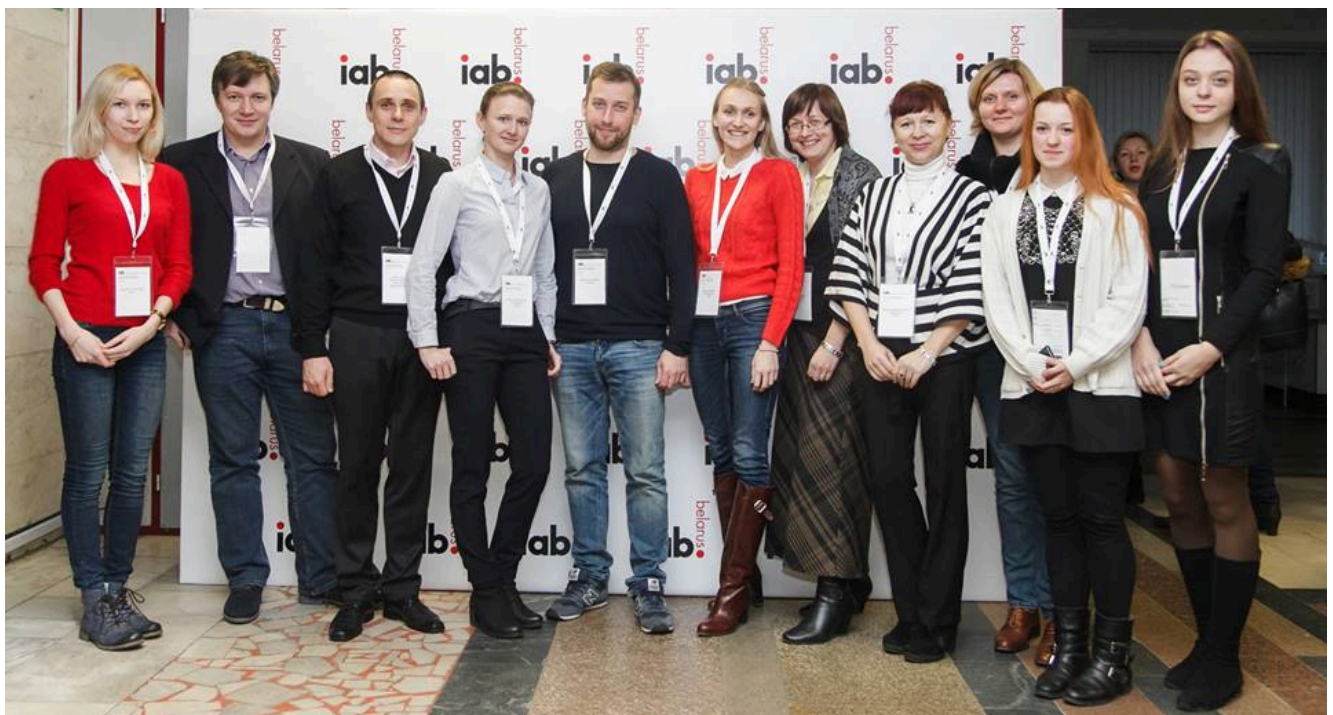
Преподаватели и студенты ФМк также посетили конференцию