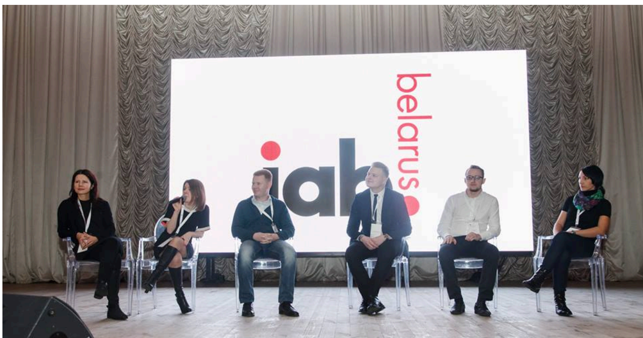
Круглый стол о перспективах рынка интернет-рекламы

Материалы выступлений и фотоотчет доступны также в Facebook на официальной странице IAB Belarus .