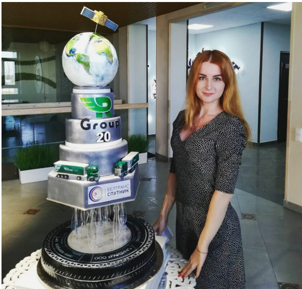
Подарки к 20-летию компании “R Group”

– Ты работаешь в компании уже около 1,5 лет. Скажи оправдались твои первоначальные ожидания?