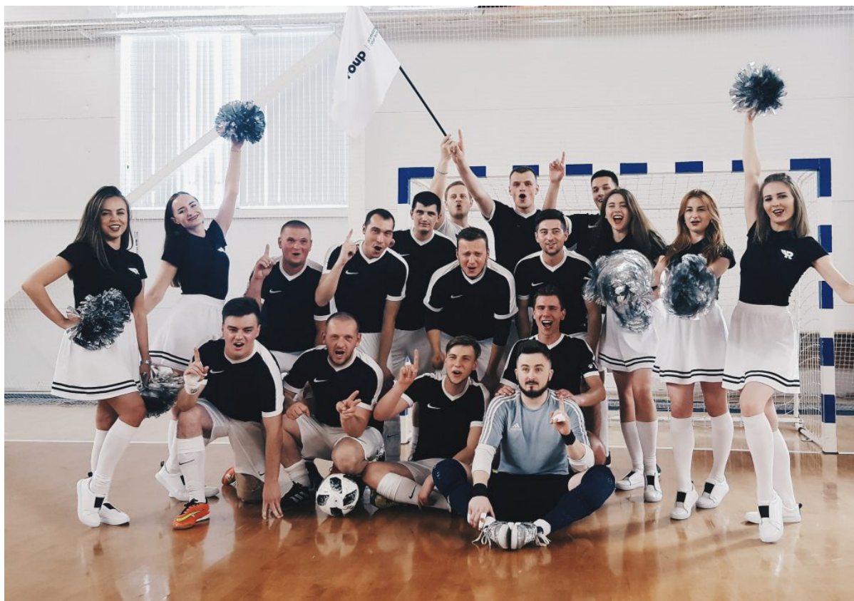
Команда R Group на турнире по футболу

Учеба на ФМк однозначно сыграла ключевую роль в карьере, однако без самостоятельного личного и профессионального развития далеко не уйдешь. Поэтому всем советую развиваться и обязательно учить языки, потому что язык – это большое преимущество при приеме на работу. Из языков порекомендую немецкий и французский. Английский – это базовый, есть у многих, а владение этими языками – редкость. Ведь шанс на развитие и демонстрацию своих способностей есть у каждого. Главное – прикладывать усилия, показать, что ты можешь и доказать это самому себе.