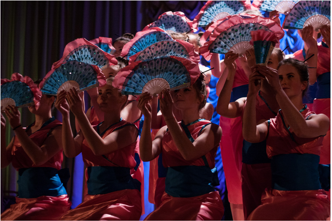
Студвесна БГЭУ 2017: ФФБД

Резкий перенос событий в Японию удивил не так ярко, как внезапно начавшийся «тектоник» в танцевальной постановке, которую исполнили студентки ФФБД, умело лавируя при этом веерами. Следующий выход произвел настоящий фурор: необычное исполнение песни, которое, как мне кажется, до сегодняшнего дня не имело «аналогов» на конкурсах студенческой самодеятельности в БГЭУ. Завершить свое выступление ребята решили, показав, как случайная ошибка одного человека может привести к непоправим последствиям – в данном случае к бомбардировке Нагасаки и Хиросимы. Это и есть «Эффект бабочки»: случайные события, но не случайный результат.