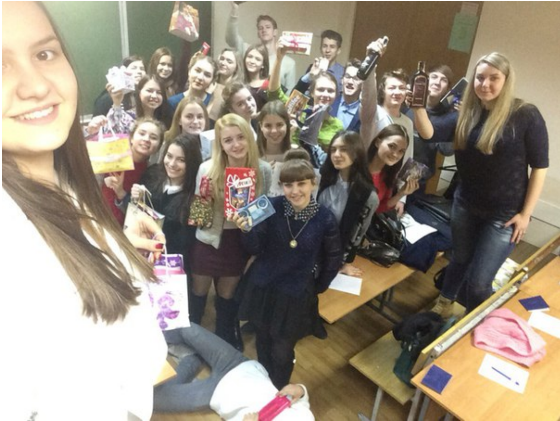
Игра Тайный Санта на ФМк – Никто не остался без подарка