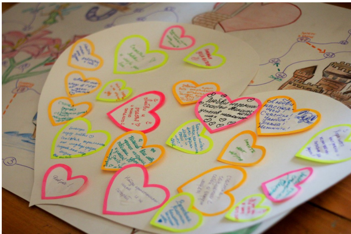
Валентинка с пожеланиями студентов ФМк