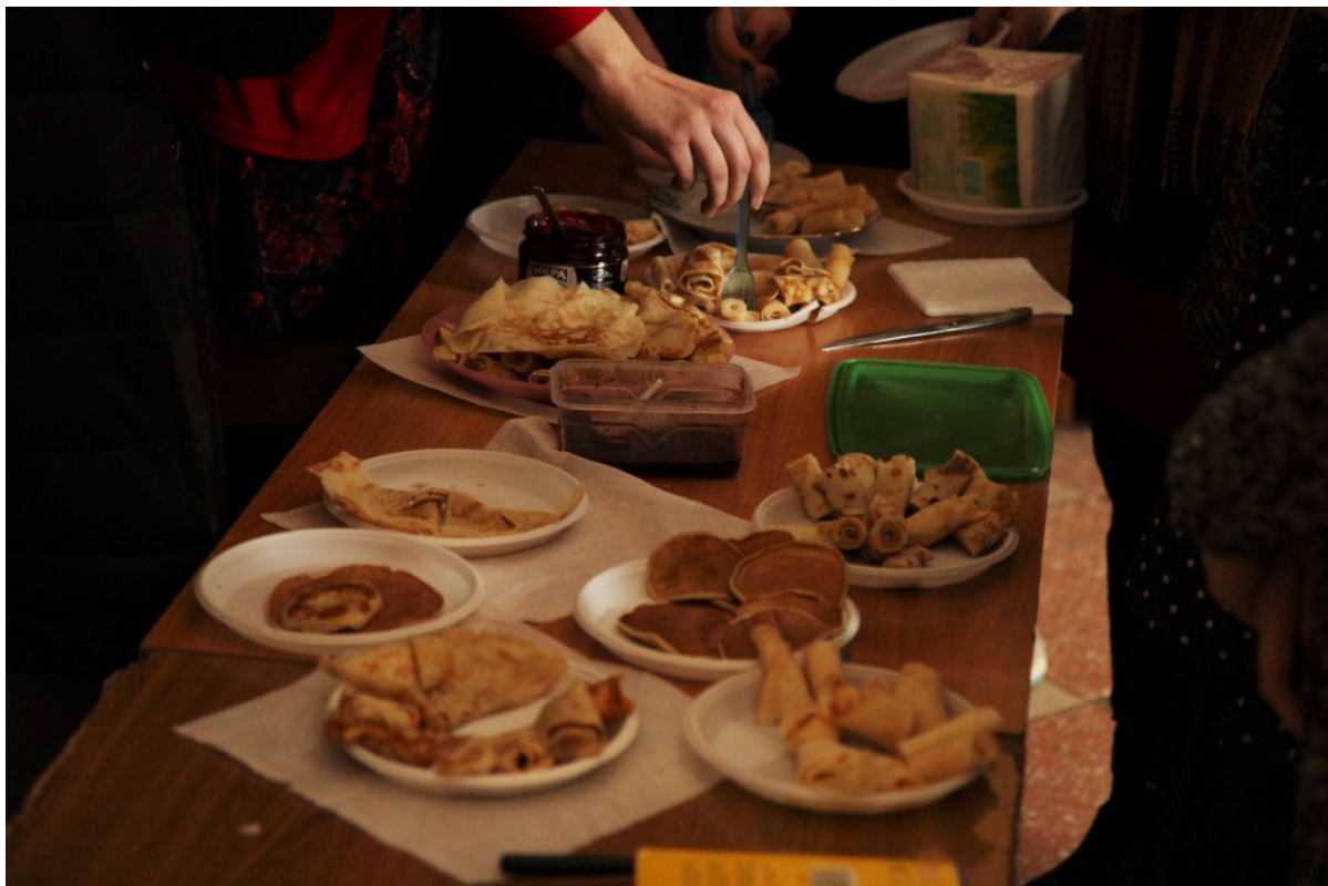
Блины на любой вкус!