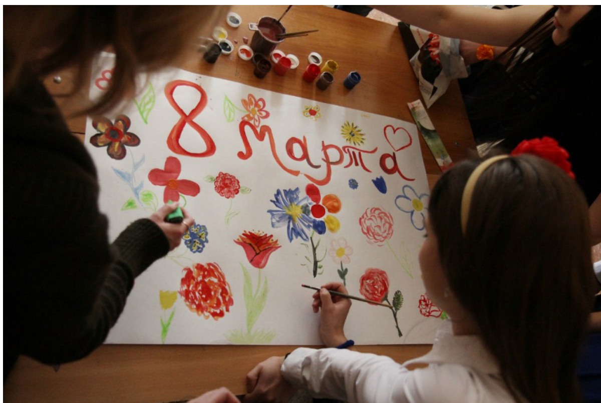
Рисуем плакат к Большой перемене для акции к 8 марта