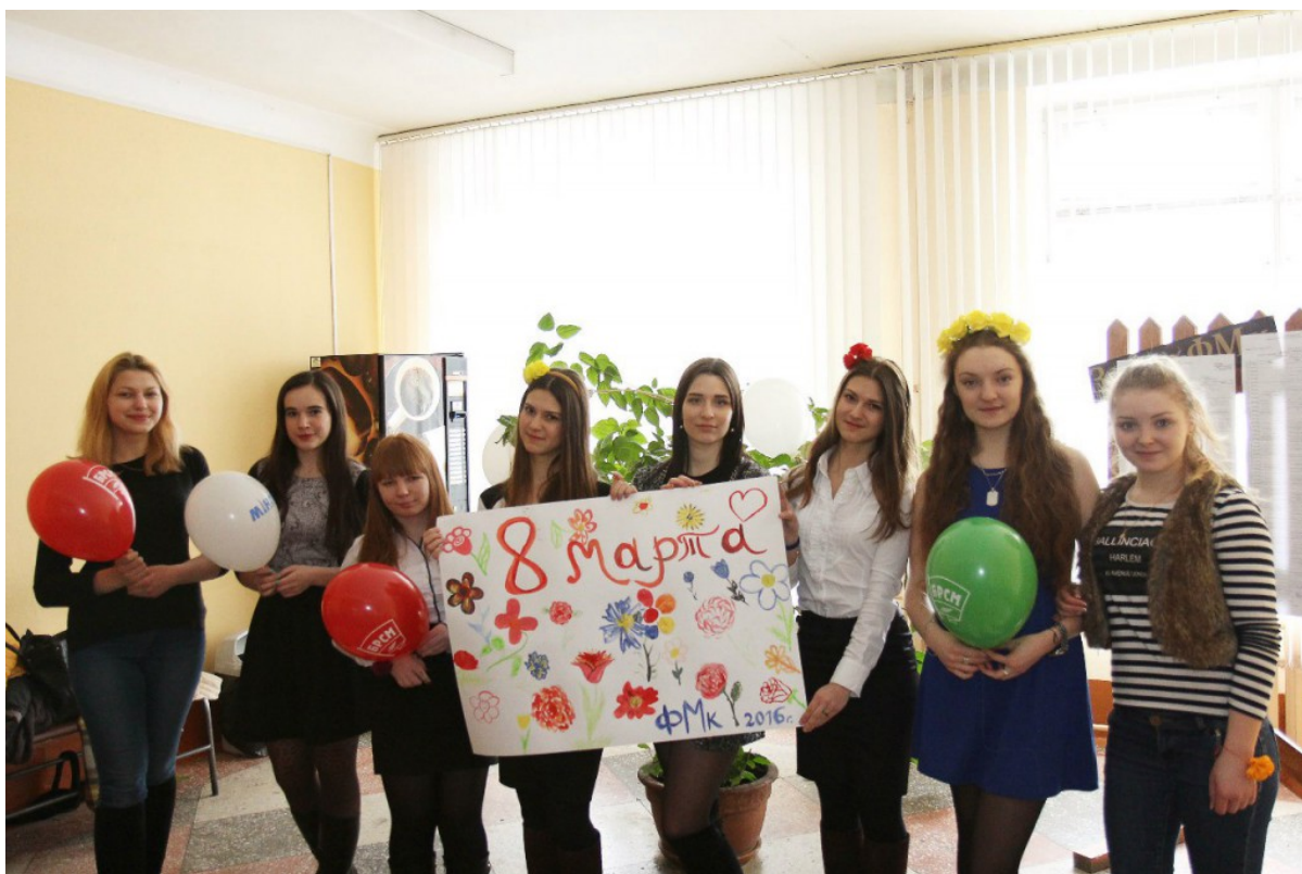
Участники акции на большой перемене

Подробный фотоотчет вы можете просмотреть в группе Профбюро ФМК .