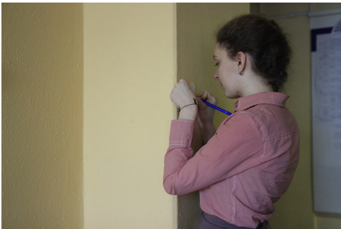
Уверены, что самые искренние валентинки пишутся именно так