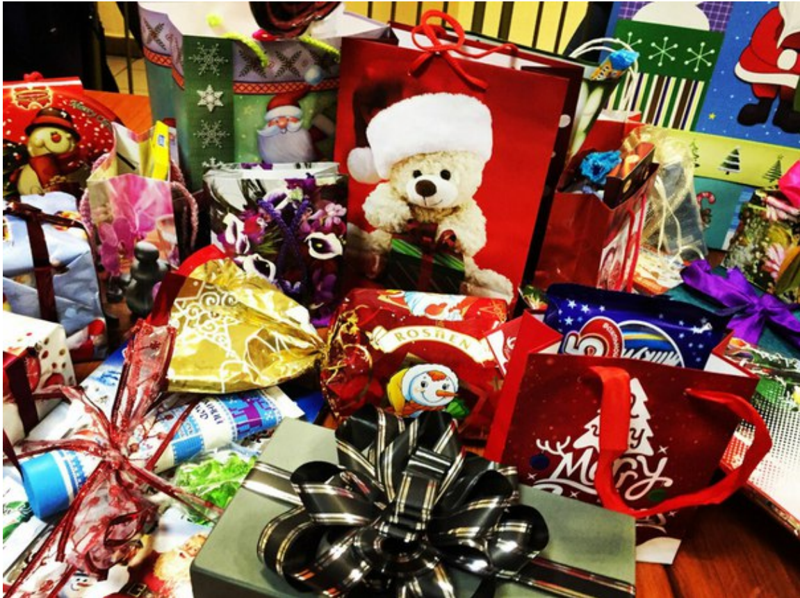
Игра Тайный Санта на ФМк – Подарки Тайного Санты

Мечты сбываются, надо просто верить и смотреть всегда вперед, туда, откуда вот-вот взойдет новое Солнце Нового 2016 года.