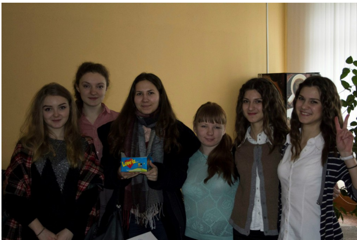
Профбюро ФМк – Организаторы акции на большой перемене 14 февраля.

Полный фотоотчет о Дне любви на ФМк можно посмотреть в альбоме