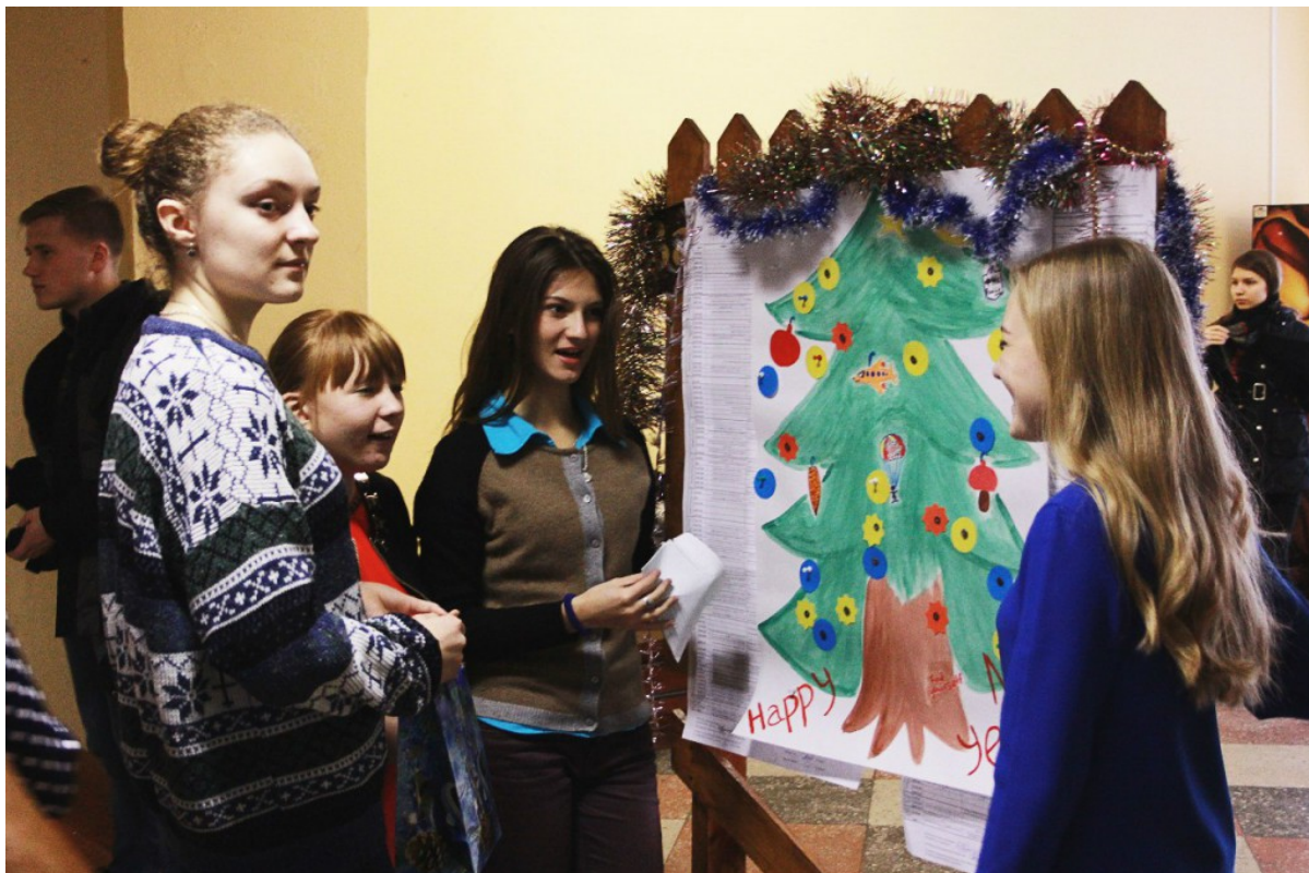
Новогодняя акция ФМк – Участники акции рядом с “Забором ФМк”