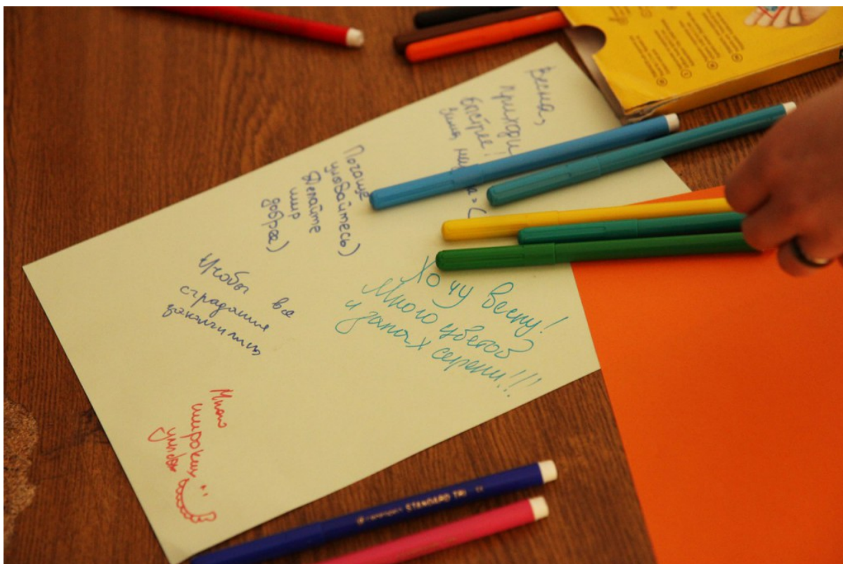
Весенние пожелания студентов на акции ФМк Масленица.