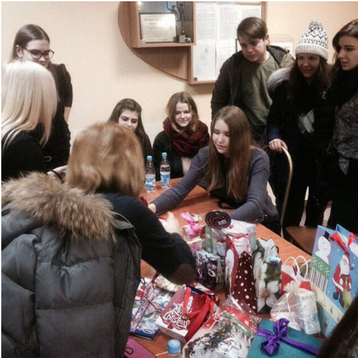
Игра Тайный Санта на ФМк – Тайный Санта делит подарки ;)