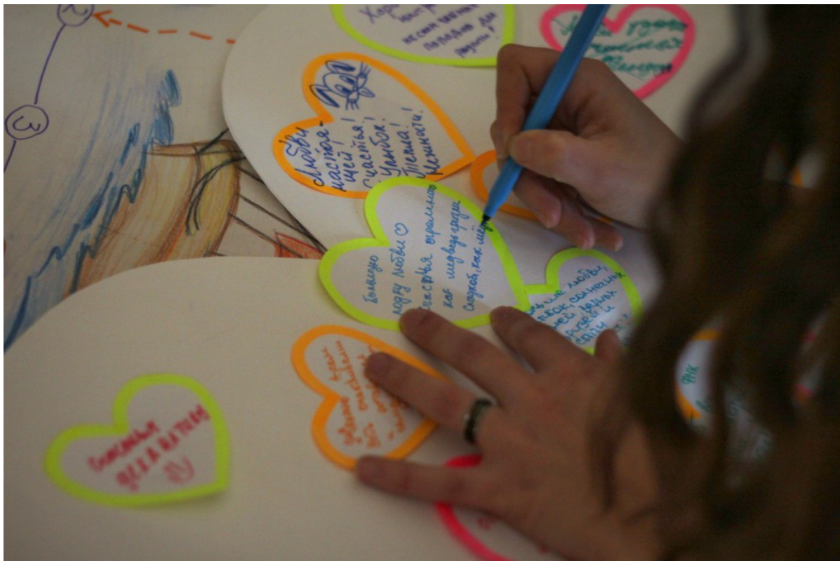
День святого Валентина на ФМк. Студенты подписывают валентинки.