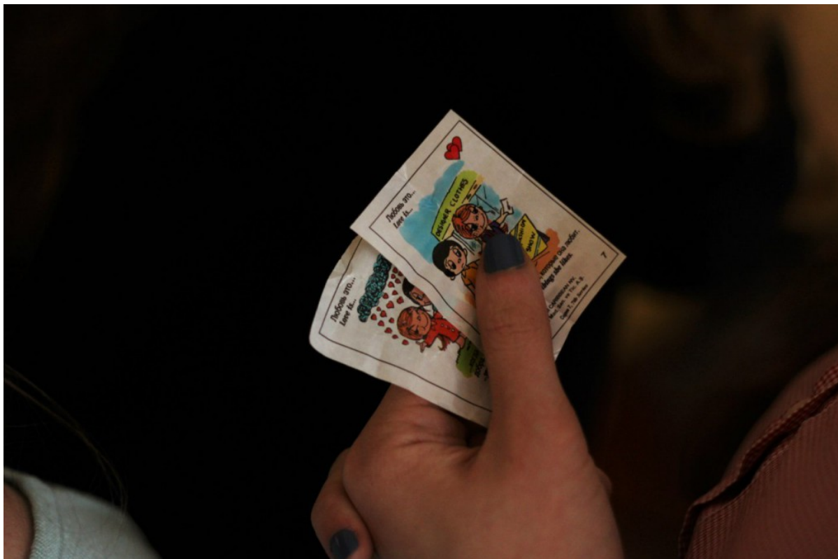
Love is..., а как же без них