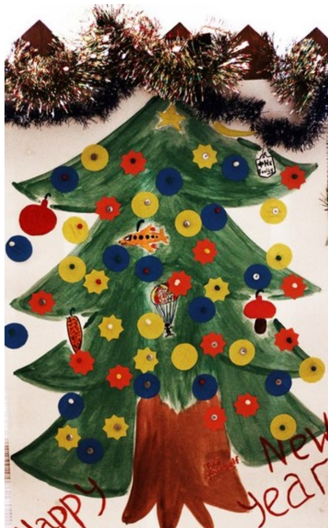
Новогдняя акция ФМк – Забор ФМк украшает новогодняя ель

Ты никогда не знаешь, где тебя настигнет удача, а потому всегда надо быть настороже, быть готовым встретить ее подарок. Среди праздных учебных будней студентов настигли пожелания на предстоящий год от профбюро ФМк, и, надеемся, что это не последний подарок всем учащимся!