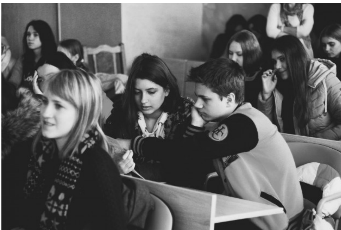
Встреча с абитуриентами на дне открытых дверей факультета маркетинга и логистики БГЭУ – 27.11.2015