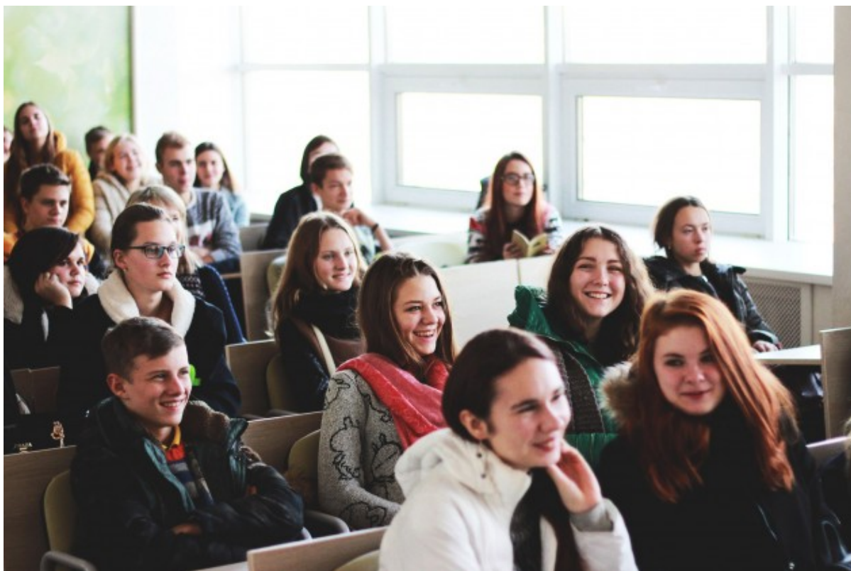
Встреча с абитуриентами на дне открытых дверей факультета маркетинга и логистики БГЭУ – 27.11.2015