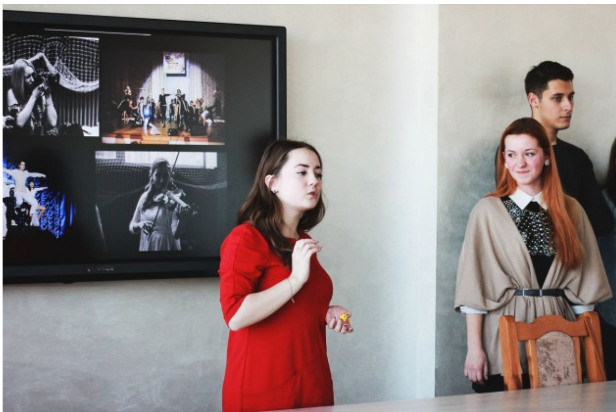
Студенты ФМк делятся опытом учебы. День открытых дверей факультета маркетинга и логистики БГЭУ – 27.11.2015