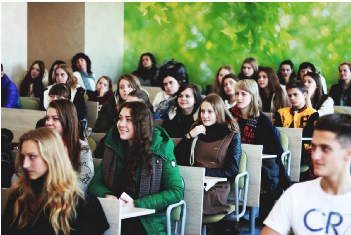
Встреча с абитуриентами на дне открытых дверей факультета маркетинга и логистики БГЭУ – 27.11.2015