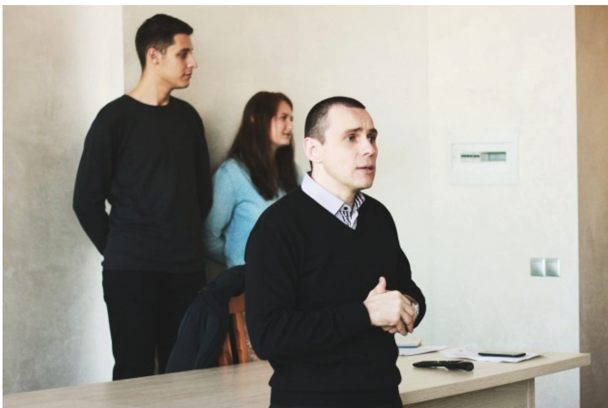
Встреча с абитуриентами на дне открытых дверей факультета маркетинга и логистики БГЭУ – 27.11.2015