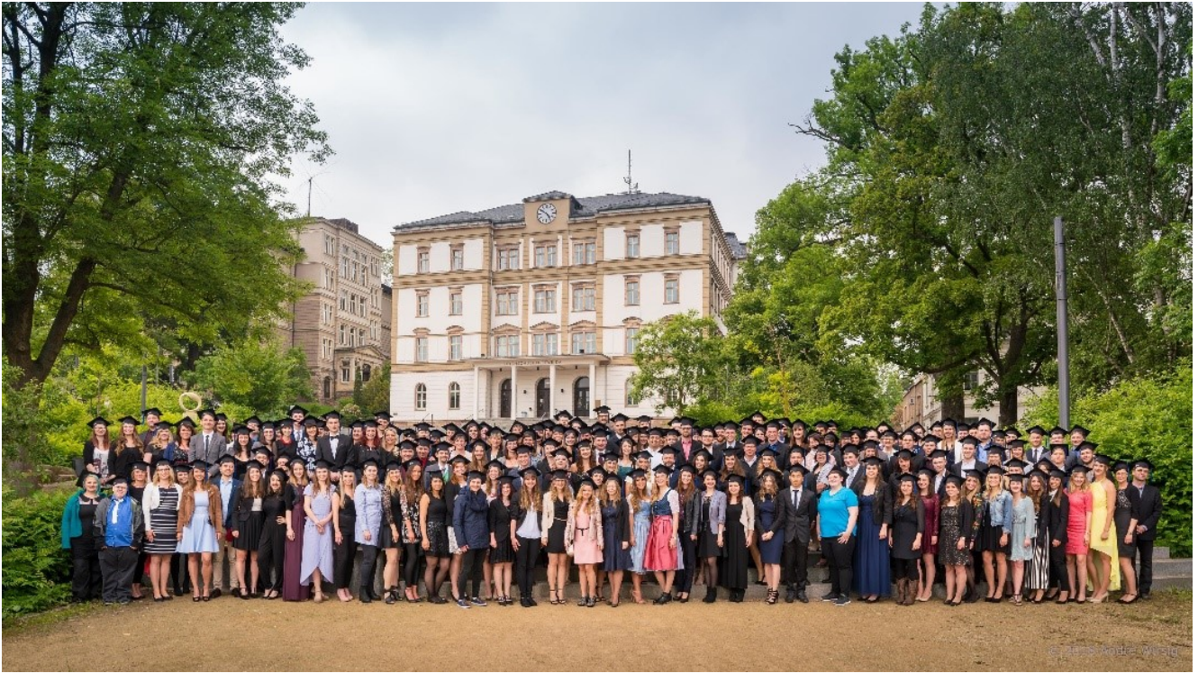
Фотосессия у главного корпуса.