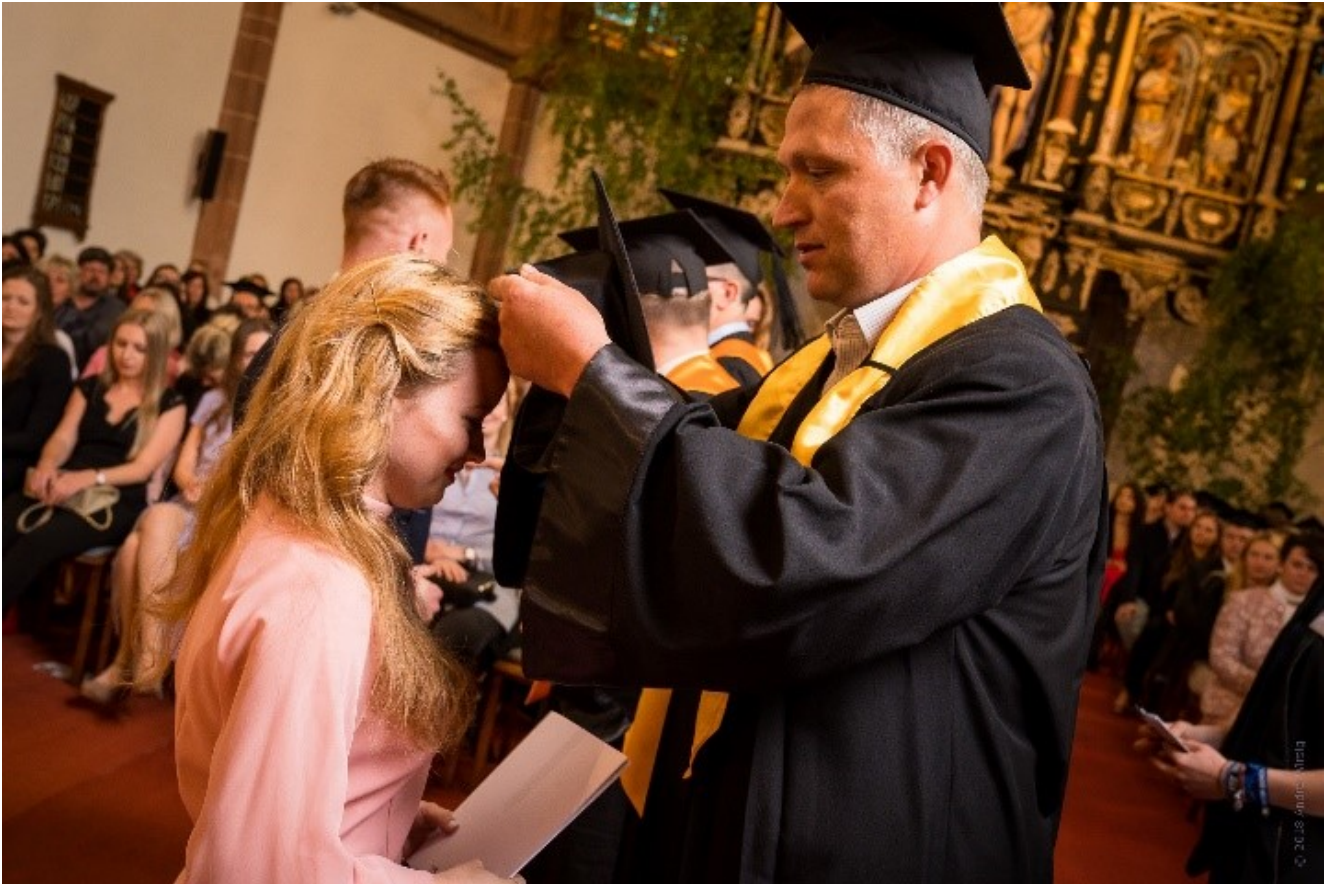
Момент, когда наконец-то получил шапочку(Р.1) □