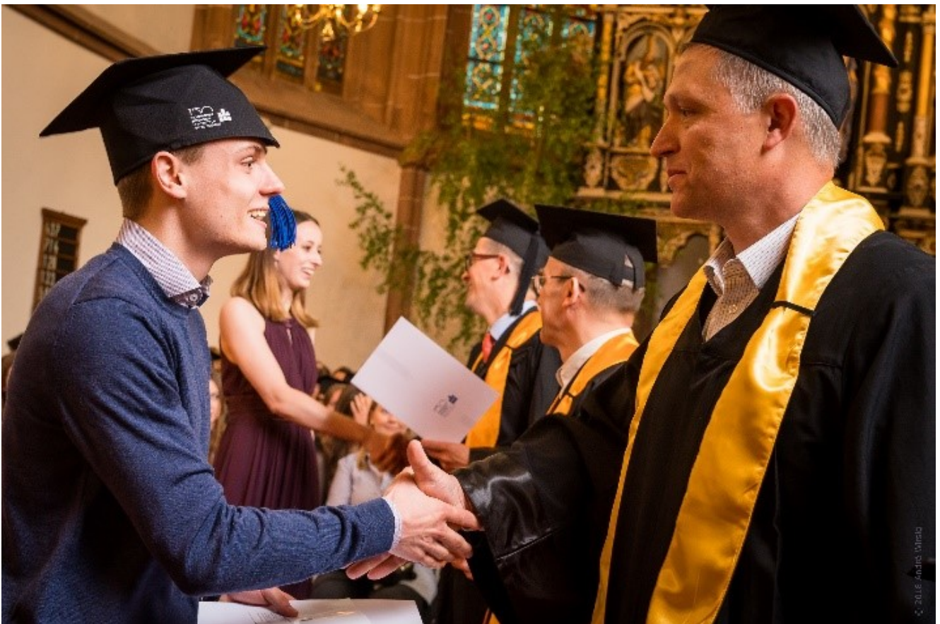
Момент, когда наконец-то получил шапочку(Р.2) □