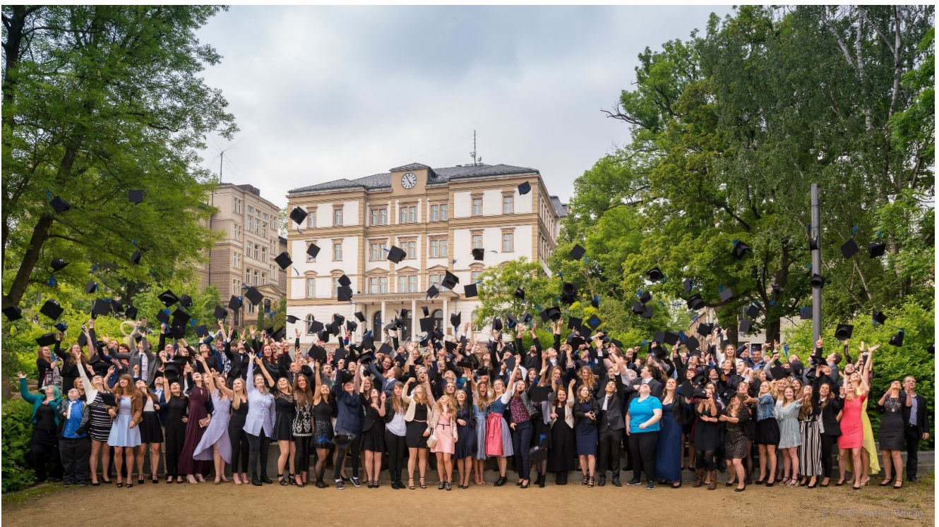
Церемония подбрасывания шапочек