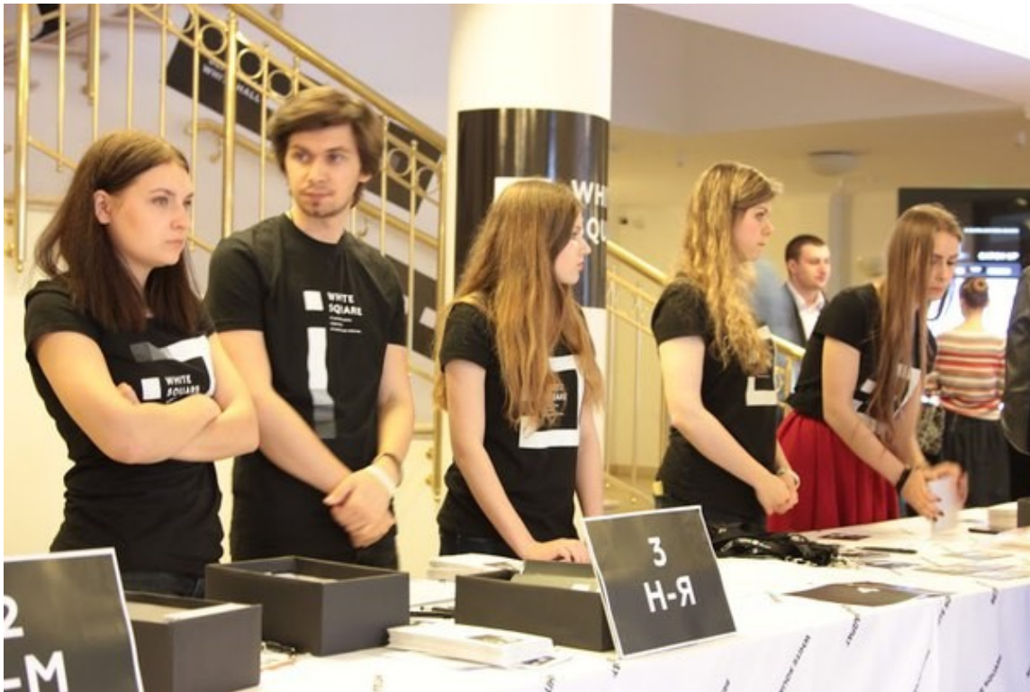
«Белый Квадрат» фестиваль маркетинга и рекламы